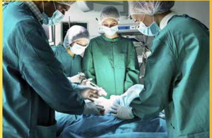
▲ Beide ziekenhuizen willen hun werkingen nog sterker op elkaar afstemmen.