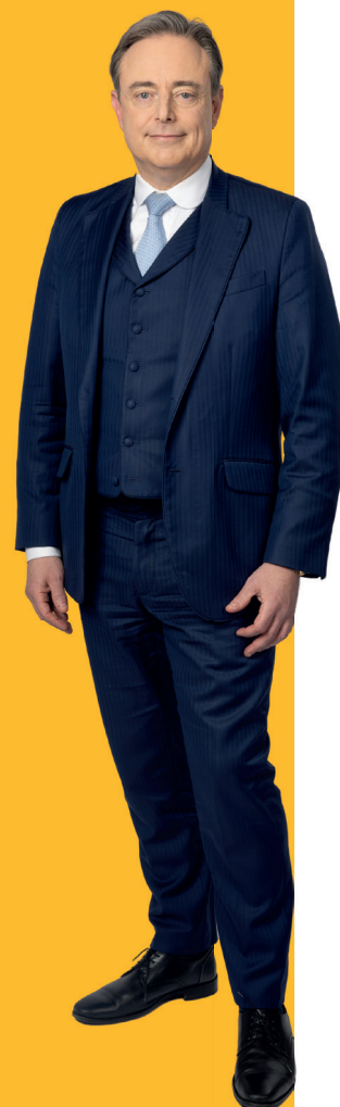
Bart De Wever Kandidaat-premier

Stem N-VA. Voor Vlaanderen. Voor welvaart.